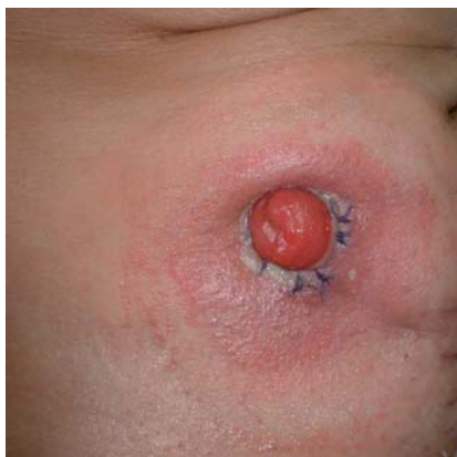
Alergická reakce na pomůcku